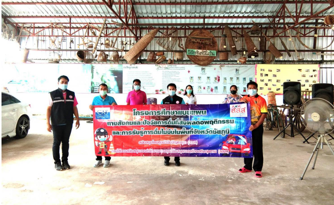
เวทีสนทนากลุ่ม