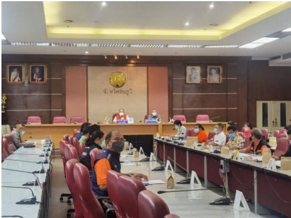
เข้าร่วมสังเกตการณ์การประชุมคณะกรรมการป้องกันอุบัติเหตจังหวัดชัยภูมิ