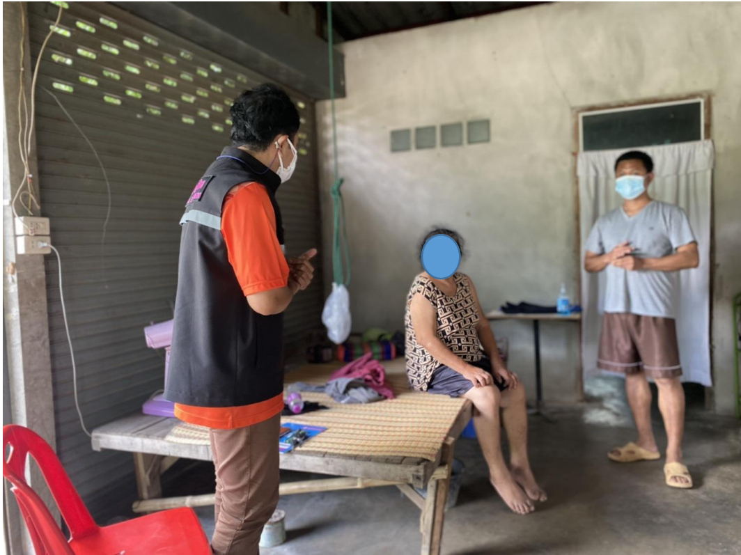
สัมภาษณ์บุคคลที่ได้รับผลกระทบจากคดีมาแล้วซ้ำ