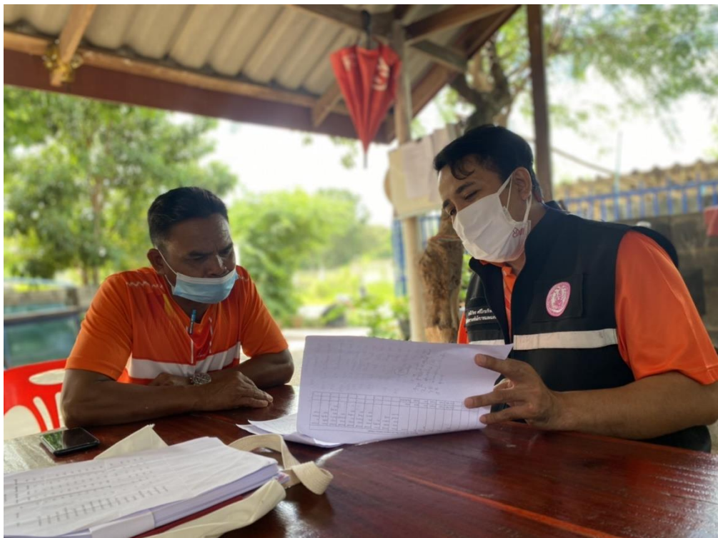
สัมภาษณ์ผู้นำชุมชน