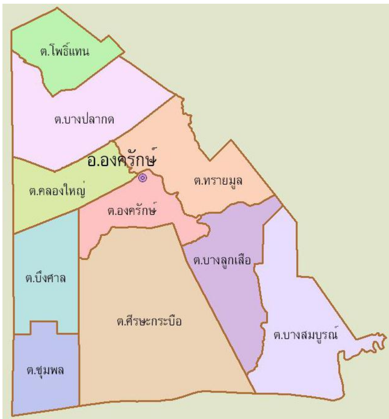
ภาพที่ 4.1 แผนที่อำเภอองครักษ์ จังหวัดนครนายก