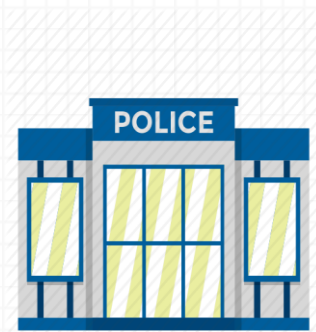
สถานีตำรวจ