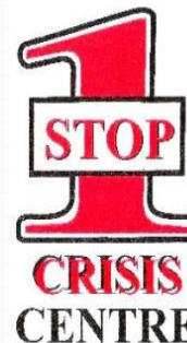
สถานสงเคราะห์ผู้ได้รับผลกระทบ