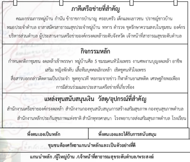
ภาพแสดง ปัจจัยความสำเร็จของชุมชนในการควบคุมการบริโภคเครื่องดื่มแอลกอฮอล์