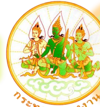
กระทรวงแรงงาน

คัดกรองและส่งต่อสถานพยาบาล สังกัดกระทรวงสาธารณสุข