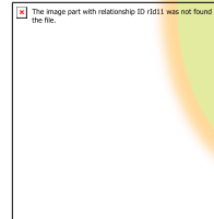
กรุงเทพมหานคร

ขอความร่วมมือสถานพยาบาลใน สังกัดกระทรวงกลาโหม และ กทม. ดำเนินการคัดกรองและบำบัดฯ