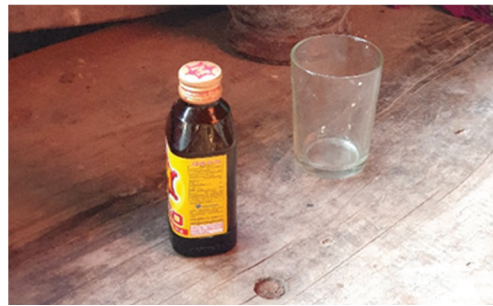
ขวดเครื่องดื่มบำรุงกำลัง 150 มล. ขวดละ 10 บาท