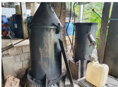
ภาพที่ 1 โรงกลั่นสุรา #1 พื้นที่ภาคเหนือ

1. โรงกลั่นสุราที่ได้รับอนุญาตให้ผลิต ขายแบบทั้งตามระบบภาษีและขายเถื่อน จำนวน 14 แห่ง คือ มีโรงเรือนที่แยกออกจากส่วนที่อาศัย ตั้งอยู่ห่างจากแหล่งน้ำ มีระบบบำบัดน้ำเสีย และสภาพภายในโรงกลั่นก็มีความสะอาดพอสมควรและแยกสัดส่วนกันอย่างชัดเจน