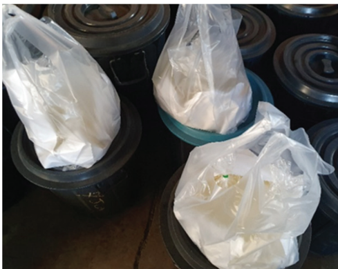
ภาพที่ 19 ราคาสาโท