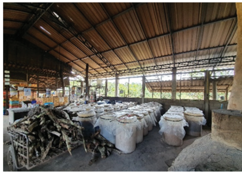
ภาพที่ 3 โรงกลั่นสุรา #3 พื้นที่ภาคตะวันออกเฉียงเหนือ โรงกลั่นสุราที่ได้รับอนุญาตผลิต ด้านข้างโรงกลั่นเป็นโรงเลี้ยงสุกร