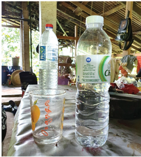
ภาพที่ 15 ราคาสุราเถื่อนแบบแก้ว-ขวดเล็ก