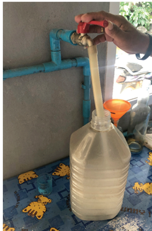
ขวด 5 ลิตร ราคา 300 - 600 บาท