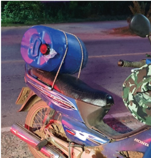
ภาพที่ 18 ราคาสุราเถื่อนแบบถัง