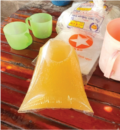
ภาพที่ 20 ราคาน้ำตาลเมา