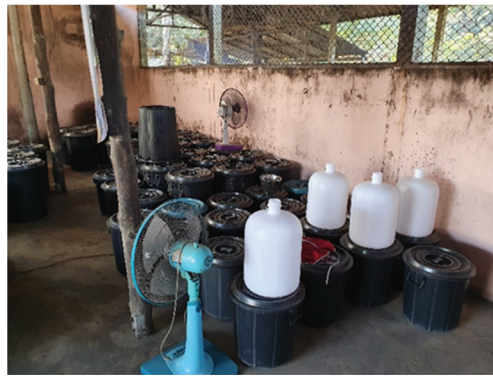
ภาพที่ 5 โรงกลั่นสุรา #5 พื้นที่ภาคใต้