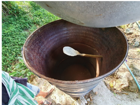
ภาพที่ 9 โรงกลั่นสุรา#9 (ไม่ได้ขออนุญาตผลิต)

โรงกลั่นสุราเถื่อนพื้นที่ภาคใต้ ตั้งอยู่พื้นที่ใกล้เขตป่าสงวนในสวนยางพาราอยู่ห่างจากตัวหมู่บ้านไปประมาณ 5 กิโลเมตร