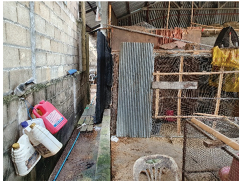
ภาพที่ 8 โรงกลั่นสุรา#8 (ไม่ได้ขออนุญาตผลิต)

โรงกลั่นสุราเถื่อนพื้นที่ภาคใต้ ช้างป่ายางพารา