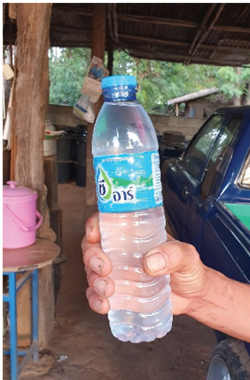
ขวดน้ำดื่มขนาด 600 มล. ราคา 40 บาท