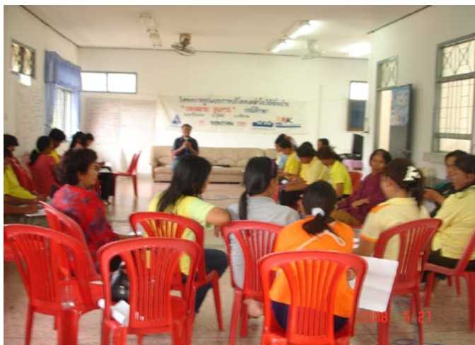
ภาพประกอบที่ 2 แสดงกิจกรรมการตอบ “ คำถามคาใจ ”

ก่อนที่จะเริ่มกิจกรรมของโครงการทางหัวหน้าโครงการวิจัยและผู้ช่วยนักวิจัยได้จัด กระบวนการที่ว่า “ คำถามคาใจ ? ” เป้าหมายของกิจกรรมนี้จะเปิดโอกาสให้นักวิจัยชาวบ้านได้ สอบถามรายละเอียดที่เกี่ยวข้องกับโครงการและเห็นว่าคำถามเหล่านั้นสามารถที่จะไขข้อข้องใจ เพื่อการดำเนินงานร่วมกันต่อไป ทั้งนี้เราได้คำถามดังนี้