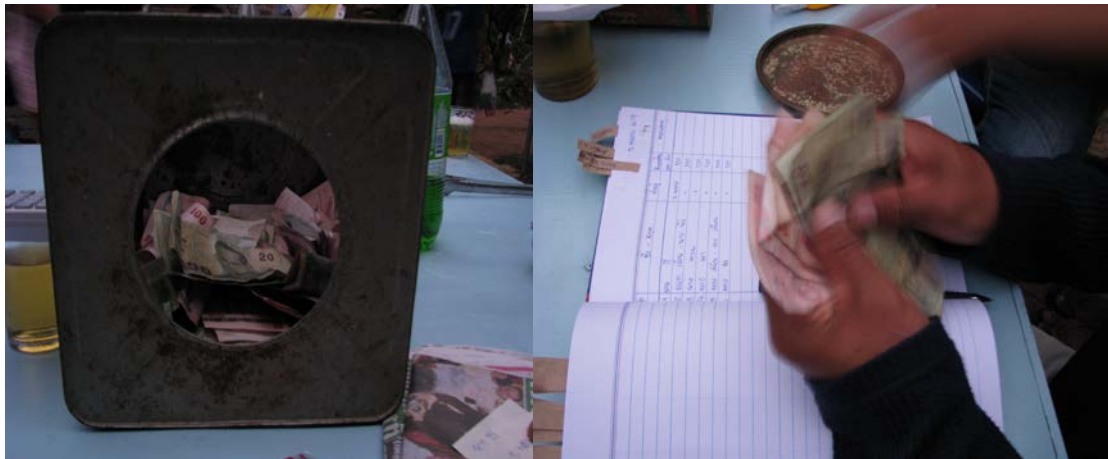
ภาพประกอบที่ 2 แสดงการนำเงินมาช่วยจุกการและการจัดบัญชีรายนามผู้ที่มาช่วยงาน

ส่วนช่วงที่สองช่วงยุค พ.ศ. 2500 เป็นต้นมาเป็นเริ่มใช้เงินเหรียญบาทและเงินที่เป็นแบงค์ ทั้งนี้เป็นช่วงที่มีการพัฒนาเศรษฐกิจ โดยการริเริ่มให้ปลูกพืชเศรษฐกิจจำพวกข้าว ปอ และมัน ลำปะหลังมากยิ่งขึ้น เงินจึงเป็นสิ่งสำคัญการจัดงานของค้าย จุกการ จึงเริ่มที่จะช่วยเป็นเงิน โดยเฉพาะในช่วงปี พ.ศ. 2515 เป็นต้นมา