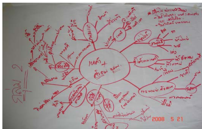
ภาพประกอบที่ 5 แสดงความสัมพันธ์ ระหว่างเหล่า สังคม ชุมชน

แม้ความหมายของประเพณีพิธีกรรมจอจาย จูยกการ ยังมีการผูกติดกับความเชื่อที่แน่นแฟ้น แต่ความสัมพันธ์ของเหล่า สังคม ชุมชน ได้มีการปรับเปลี่ยน อย่างงานพิธีกรรมมีความเปลี่ยนแปลงจากสมัย