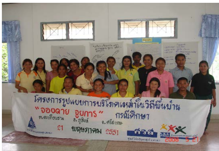
ภาพที่ 1 ภาพแสดงสมาชิกผู้เข้าร่วมประชุมเพื่อพัฒนาเป็นนักวิจัยชาวบ้าน

หลังจากนั้นทางโครงการวิจัยได้เปิดตัวเป็นทางการและได้จัดเวทีเกี่ยวกับการค้นหาตัวนักวิจัยและการประชุมชี้แจงโครงการทำความเข้าใจกับกลุ่มเป้าหมาย