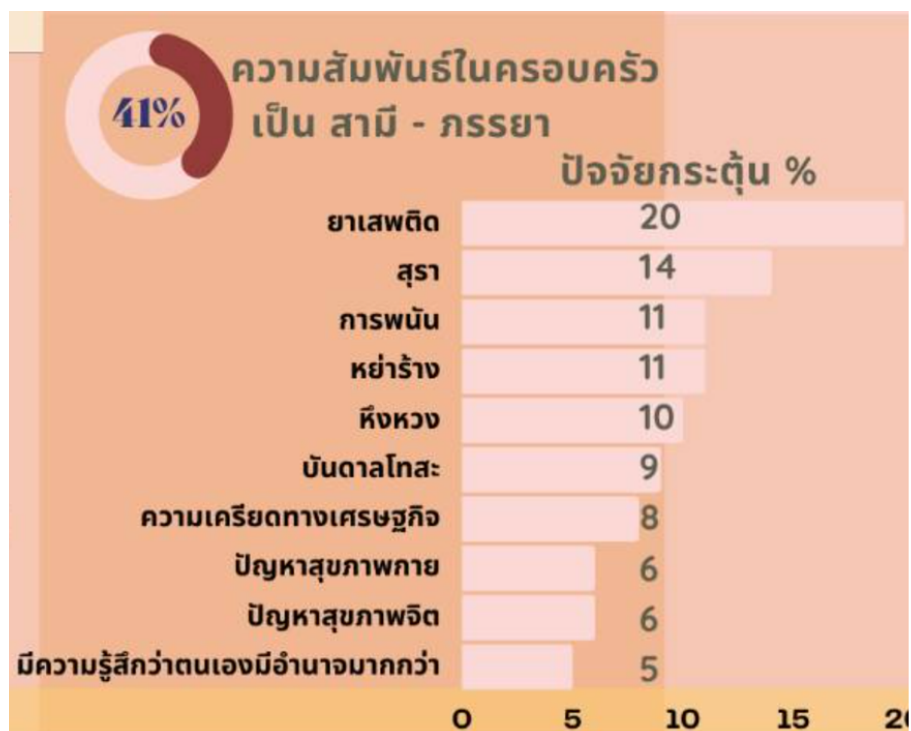
ภาพที่ 2.1 ปัจจัยกระตุ้นที่ก่อให้เกิดความรุนแรงในครอบครัว

ข้อมูลจากศูนย์พึ่งได้กระทรวงสาธารณสุขพบว่าในปีตั้งแต่เดือนมกราคม 2564 มีมากกว่า 3 หมื่นราย ข้อมูลจากมูลนิธิเพื่อนหญิงนั้นได้รับการร้องเรียนปีละไม่น้อยกว่า 600 เรื่อง แต่ในช่วงโควิดข้อมูลตั้งแต่ มกราคม-กันยายน 2564 ปรากฏว่ามีมากขึ้นถึงประมาณ 1800 เรื่อง โดยสามารถแบ่งสาเหตุการร้องเรียนออกเป็น 3-4 กลุ่มๆ แรกถูกกระทำความรุนแรงในครอบครัวซึ่งมีปริมาณมากถึง ร้อยละ 80 กลุ่มที่สองเป็นเรื่องการถูกล่วงเกินทางเพศ ทั้งการใช้วาจา การลวนลามทางร่างกายไปจนถึงการถูกข่มขืน และรัมโทรม กลุ่มที่สามเป็นการตั้งครรภ์ไม่พร้อม โดยมากเป็นแม่ที่อายุน้อยเป็นเยาวชน รวมไปถึงการหลอกว่าให้ออกไปเจอกัน แล้วเอาเพื่อนมารุมโทรม กลุ่มที่สี่เป็นเรื่องการหาประโยชน์จากผู้หญิงเพื่อการค้าประเวณี รวมไปถึงการแบล็คเมล (Blackmail) ทางเพศ เช่น เป็นแฟนกันแล้วถ่ายคลิปขณะมีเพศสัมพันธ์กัน เมื่อฝ่ายหญิงจะขอลีกก็ข่มขู่ว่าจะเปิดเผยคลิป หรือการล่อลวงผ่านการคบกันทางโซเชียลมีเดีย การถูกหลอกจากชายต่างชาติว่ารักอยากแต่งงาน ขอให้ไปอยู่ด้วยกัน แต่หลอกให้ส่งเงินค่าเครื่องบินมาให้ แล้วปิดเฟซบุ๊กหนีหายไป เป็นต้น ประเด็นที่สำคัญของการใช้ความรุนแรงในครอบครัวมิใช่แค่เรื่องการทำร้ายร่างกายเท่านั้น แต่รวมถึงการทำร้ายทางจิตใจ เช่น